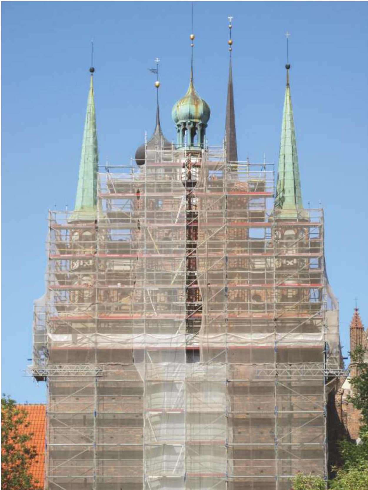
2019 Konserwacja szczytu i elewacji wschodniej prezbiterium