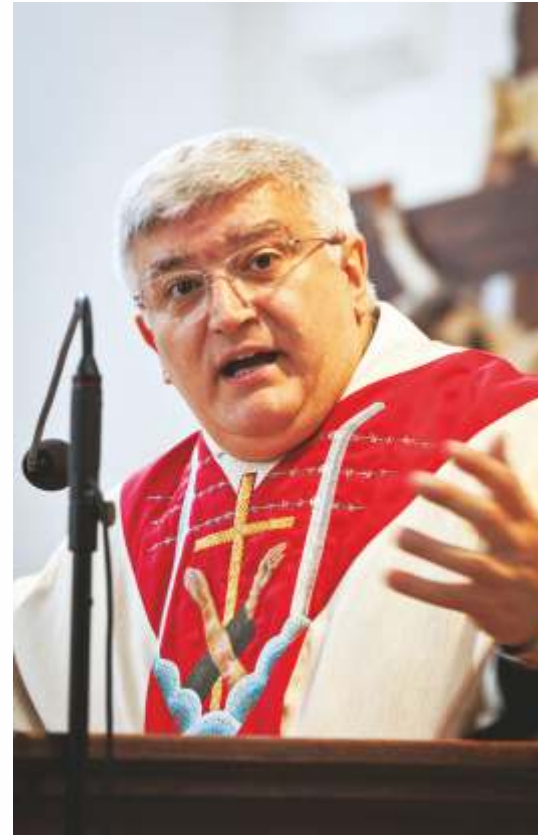
General zakonu Braci Mniejszych Konwentualnych o. Marco Tasca