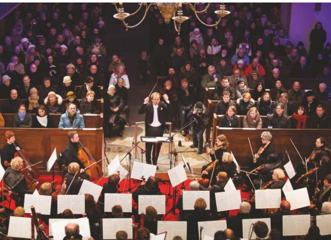
Missa Pro Pace Wojciecha Kilara, 12 grudnia 2010 r.