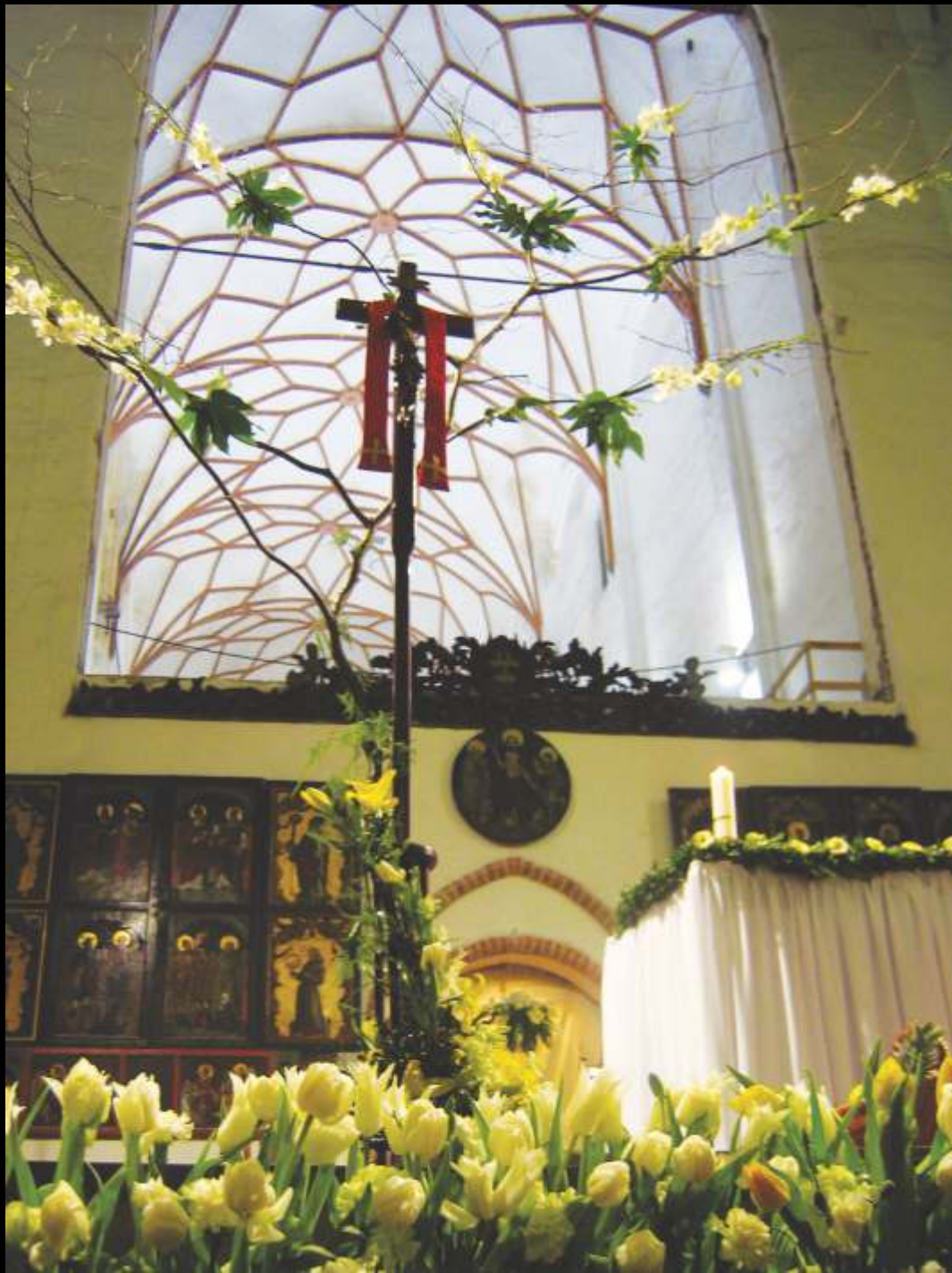
Paschalne świętowanie ...