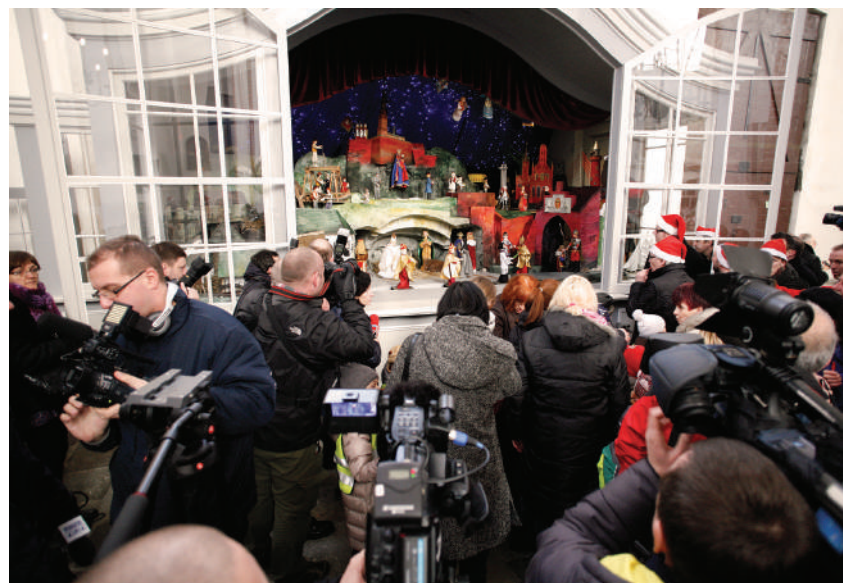
Otwarcie ruchomej szopki po gruntownej przebudowie, 16 grudnia 2011 r.