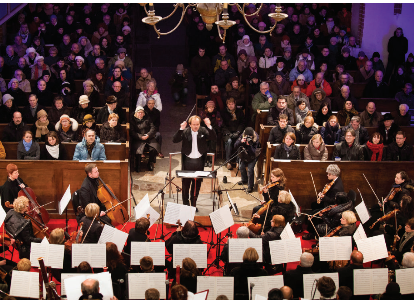
Missa Pro Pace Wojciecha Kilara, 12 grudnia 2010 r.