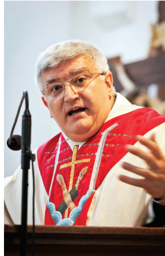
General zakonu Braci Mniejszych Konwentalnych o. Marco Tasca