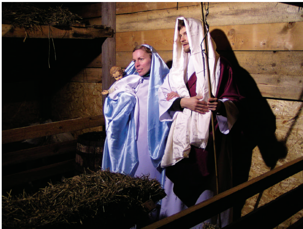
W żywej szopce na dziedzińcu, grudzień 2010