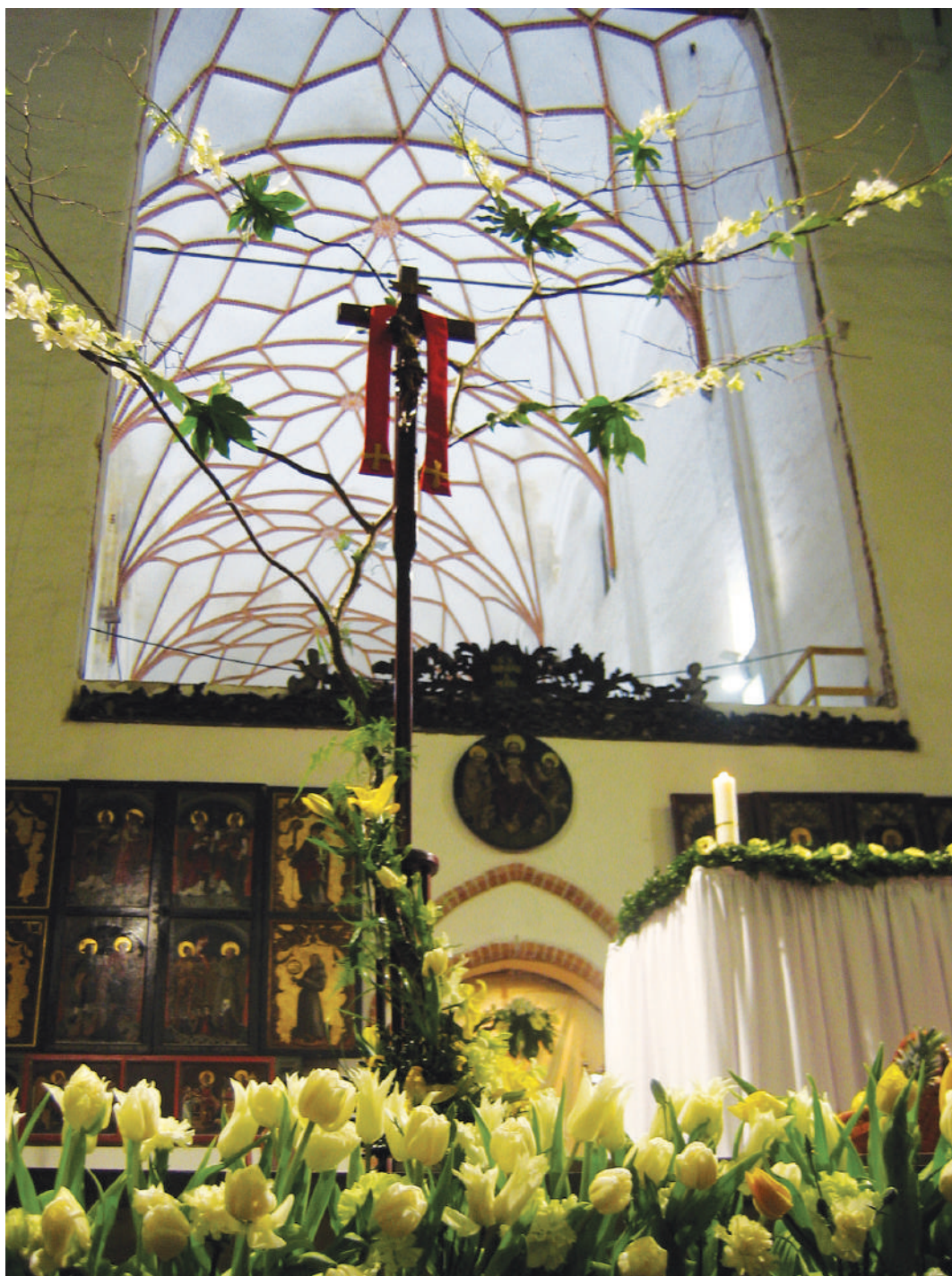
Paschalne świętowanie ...